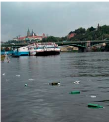
▲ Бутылки отправляются в плавание