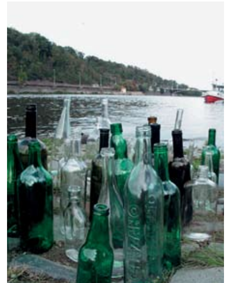
▲ Пустые бутылки ждут записок с призывами о помощи