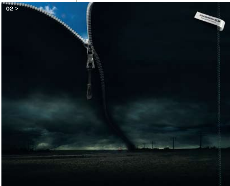
01–02 > «Экипируйся для приключения» — призыв в духе независимых. И картинка здесь удачная, этому духу под стать. Работа агентства Young & Rubicam (Мадрид)

А вот интервью со специалистом по визуальным коммуникациям: