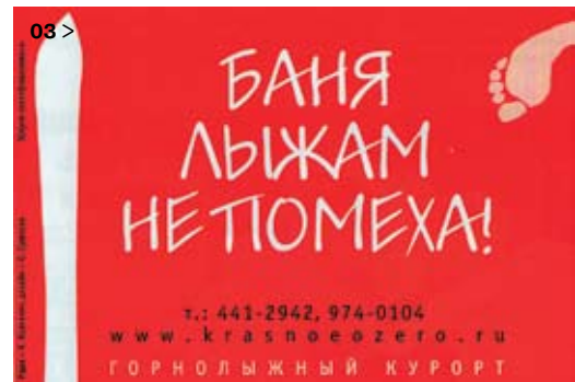
03 > Эта реклама довольно точно нацелена на независимых. Работа агентства «Экспресс-сервис» (Санкт-Петербург) 04 > В тексте этой рекламы независимый найдет милые его сердцу глаголы

Тут и плита новая-необычная, и интересно — удастся ли все-таки обжечься самому и добиться пригорелой каши?