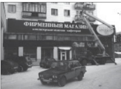
Рабочий момент монтажа вывески, сделанной по технологии «световой короб». Лицевая поверхность — банерное полотно, подобранное по «пантону» фирменного цвета. В вечернее время суток такая вывеска ярко светится издали

Название говорит само за себя. Как правило, сам короб изготавливается из специальных готовых алюминиевых