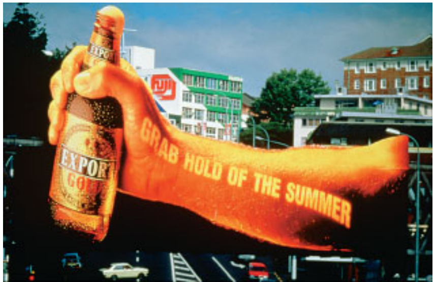
Пивная пена вот-вот залетит проезжающую машину... «Хватай лето!» Нехитрый креатив искупается величиной картинки и ее качеством

Если вы ремонтируетесь, зачем простаивать забору? Используйте любопытство людей, создайте эффект ожидания... И тогда внимание к вашему объекту не придется привлекать шумной презентацией!