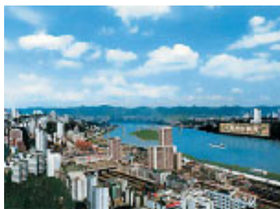
Это панно, установленное в одном из китайских городов, вошло в Книгу рекордов Гиннеса. Высотой оно 45 метров и длиной 300

Гигантский размер превращает любую банальность в уникальное произведение. Большие размеры притягивают взгляды, заставляя людей поворачивать головы. Если шоколадка размером 10 метров — не обратить на нее внимание практически невозможно! Аксиома действенности огромных размеров не требует доказательств и