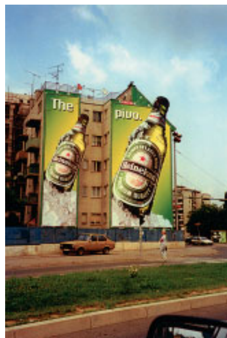
Чтобы использовать брандмауэры , нужны громадные изображения. Большая бутылка пива возникает внезапно и оставляет впечатление у каждого водителя, пешехода