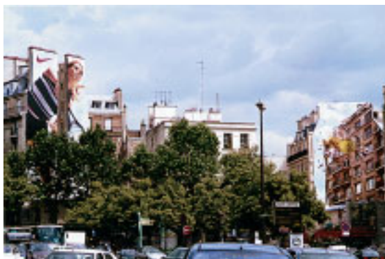
Агрессивная реклама? Да, но ведь это шутка. Одной такой рекламной установки достаточно, чтобы обратить внимание на марку