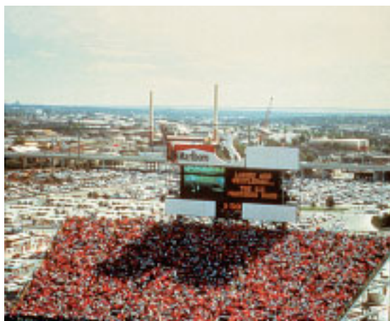
Пустые трибуны, попадающие в телекамеру, были просто закрыты панно с изображенными зрителями