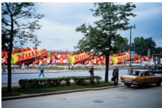
Эта реклама привлекает внимание и летом и зимой, не теряя красочности. Всегда аппетитный Nuts!