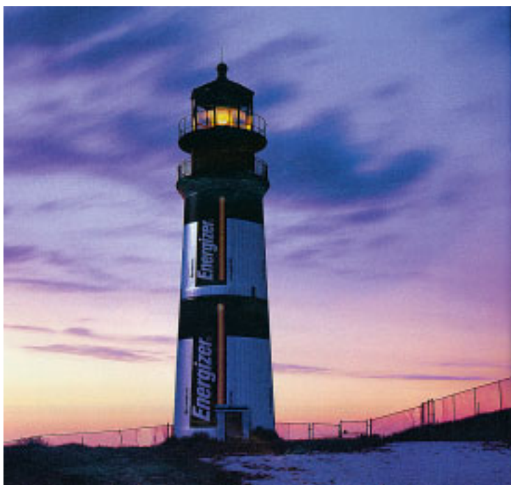
Формы архитектурных сооружений иногда как нельзя кстати подходят для рекламы некоторых товаров. Нужны только фантазия и современная технология печати (из рекламы фирмы 3M)